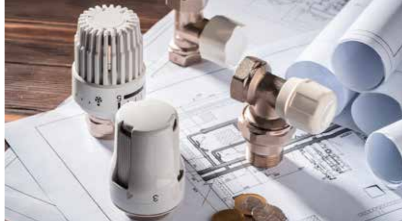
Von der Beratung über die Planung bis zum Service: Wir stehen Ihnen bei Ihrem Projekt zuverlässig zur Seite.