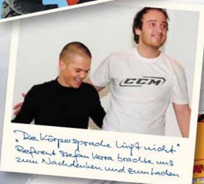
„Die Körpersprache läßt nicht Refrent tiefen kerra brachte uns zum Nachdenken und zum lachen“