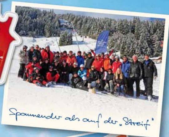
Spannender als auf der „Streif“