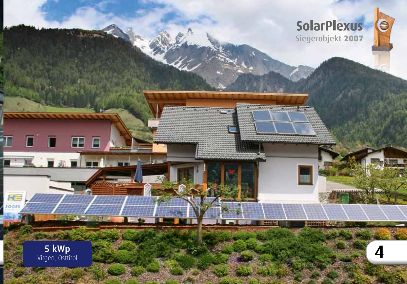
5 kWp Virgen, Osttirol