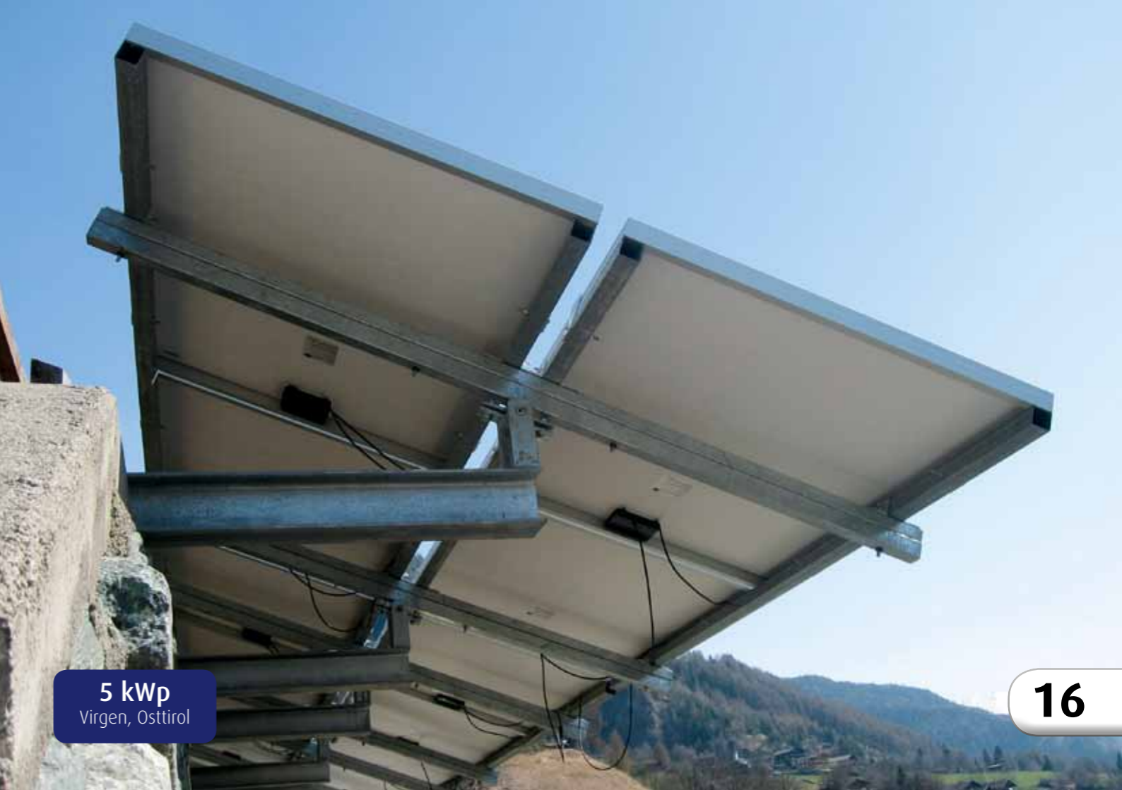
5 kWp Virgen, Osttirol