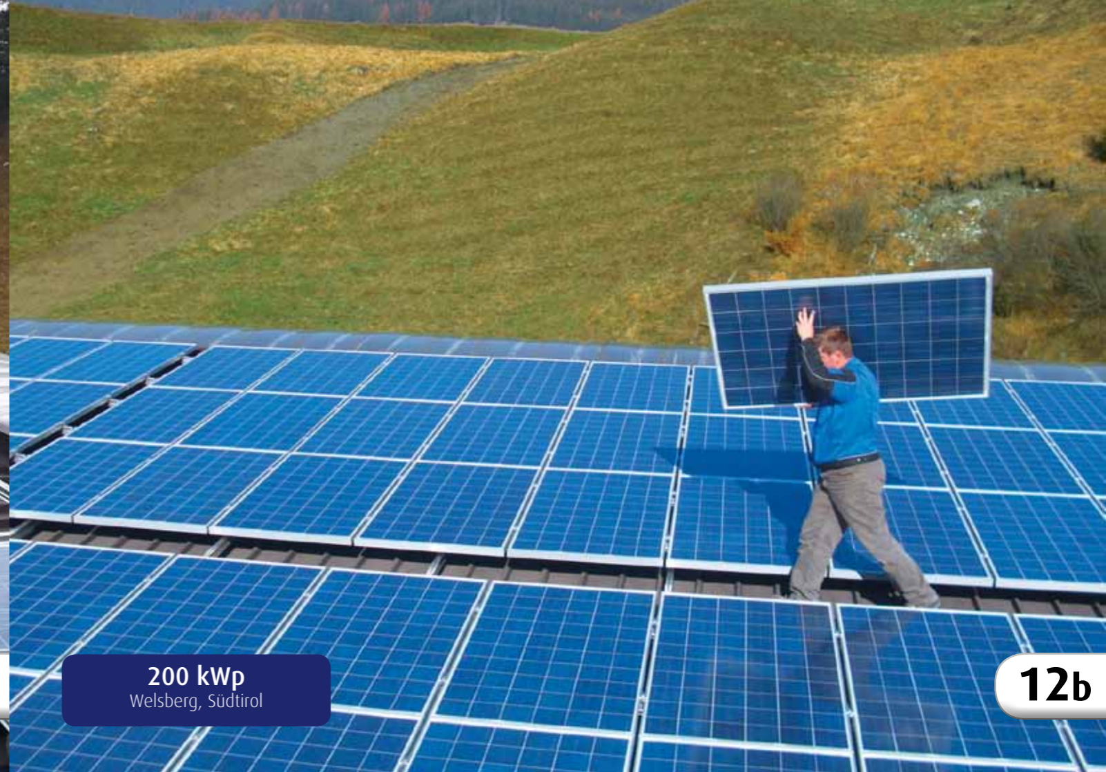
200 kWp Welsberg, Südtirol