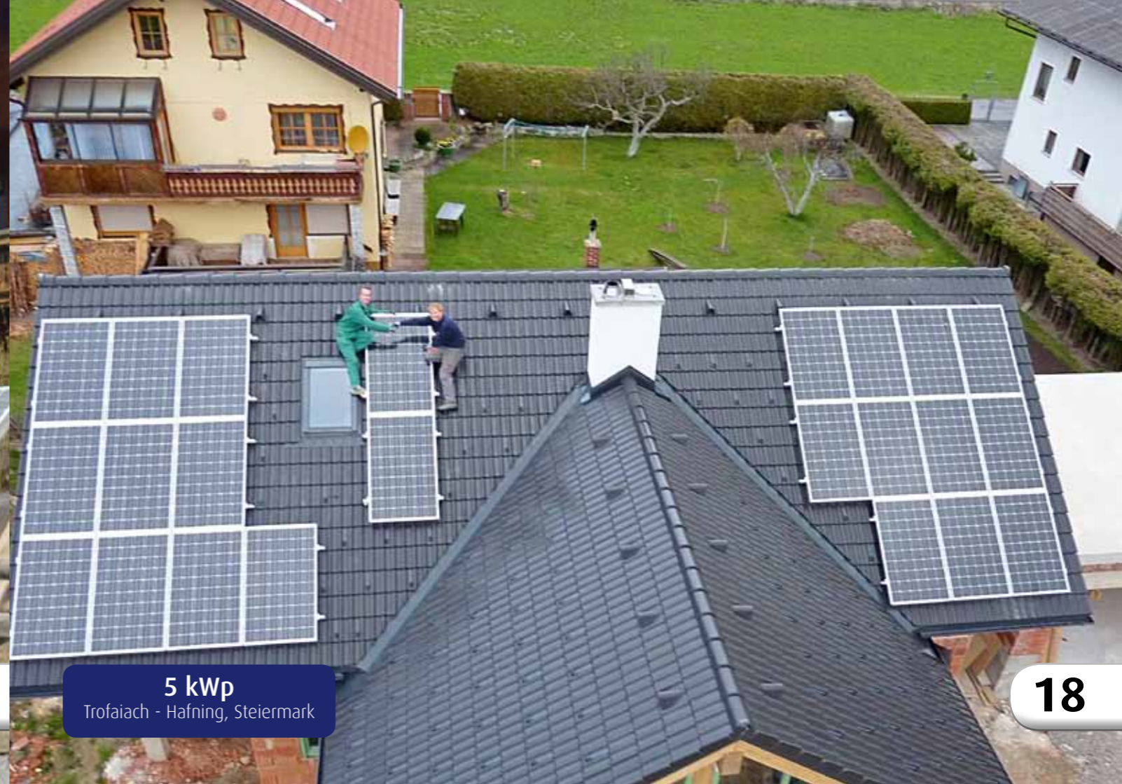
5 kWp Trofaiach - Hafning, Steiermark