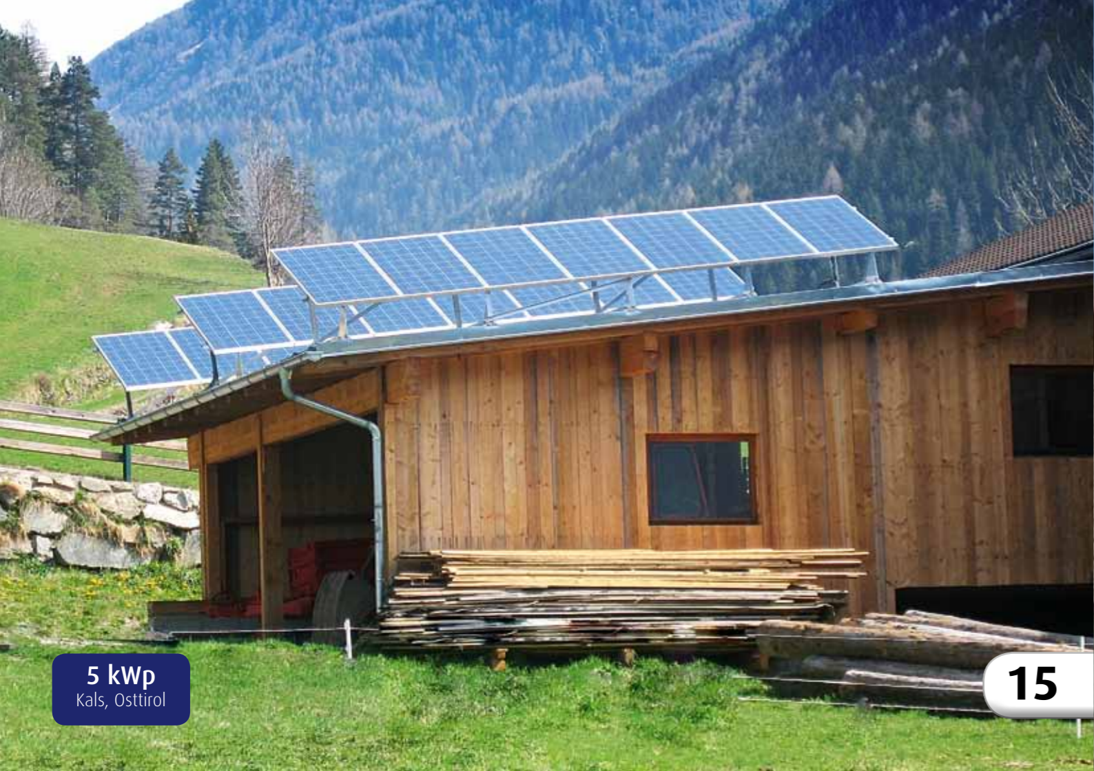
5 kWp Kals, Osttirol