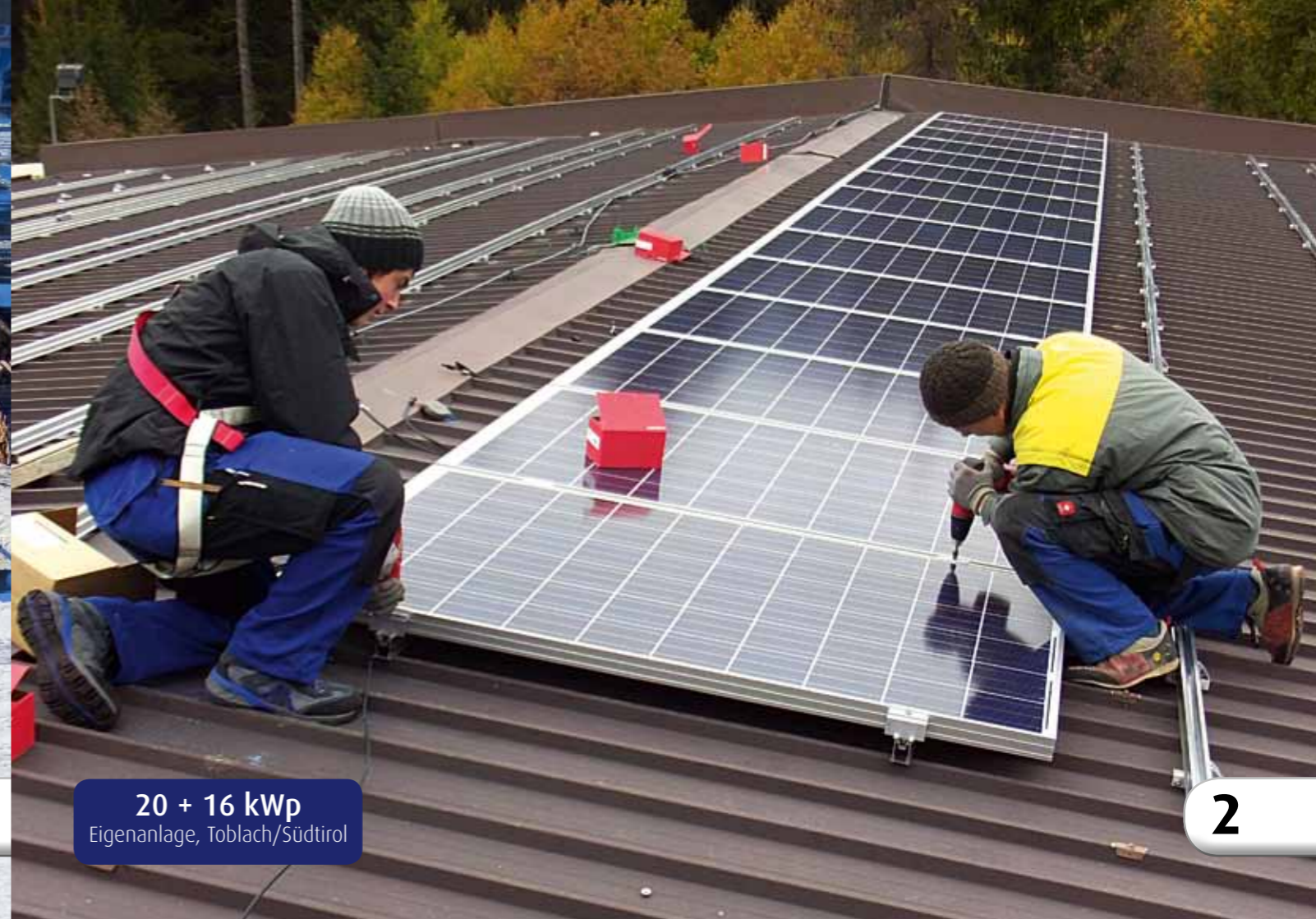
20 + 16 kWp Eigenanlage, Toblach/Südtirol