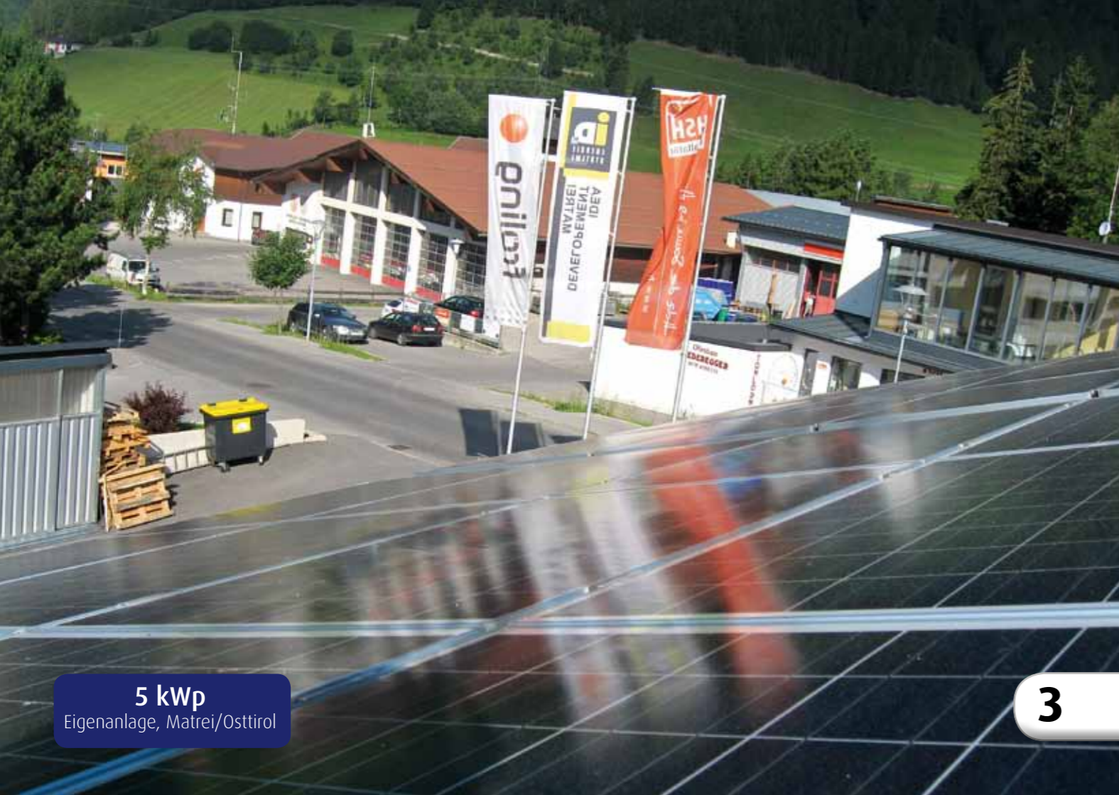
5 kWp Eigenanlage, Matri/Osttirol