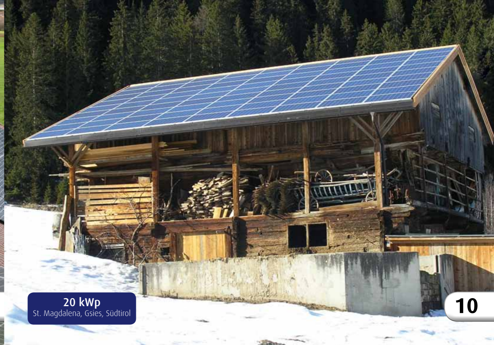
20 kWp St. Magdalena, Gsies, Südtirol