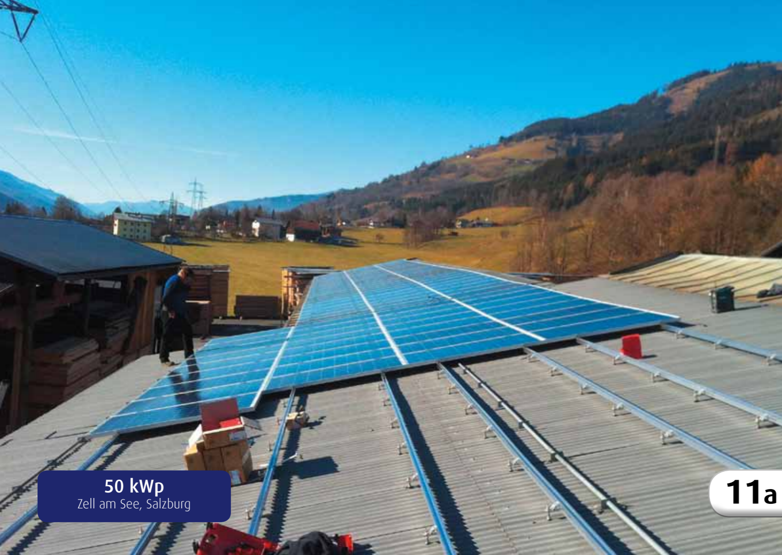
50 kWp Zell am See, Salzburg