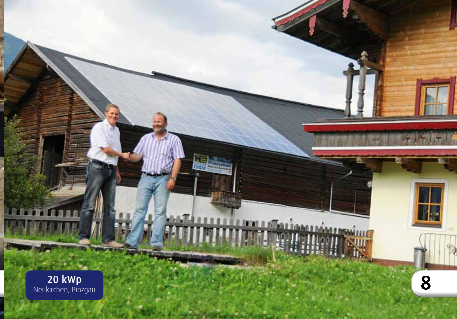
20 kWp Neukirchen, Pinzgau