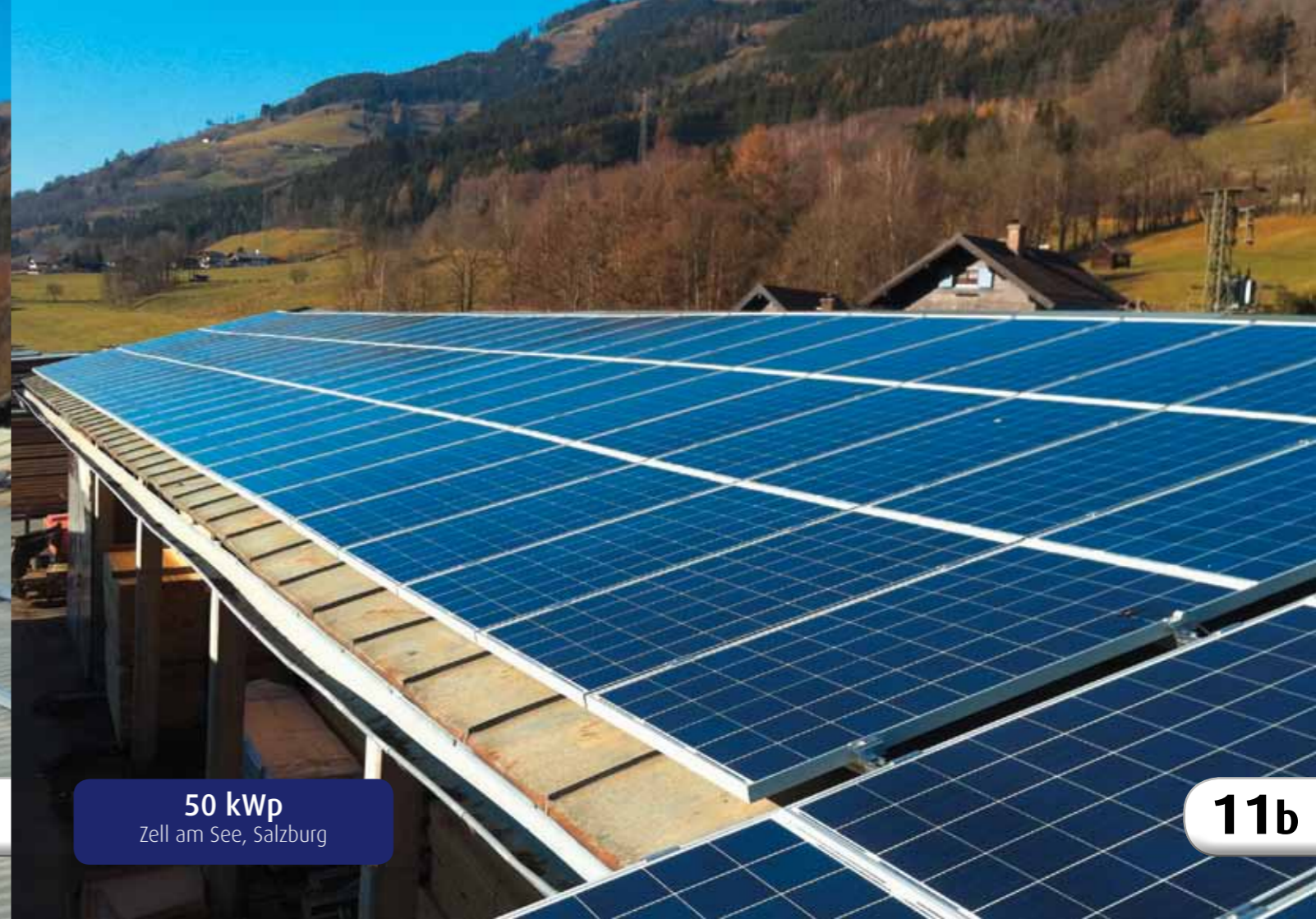
50 kWp Zell am See, Salzburg