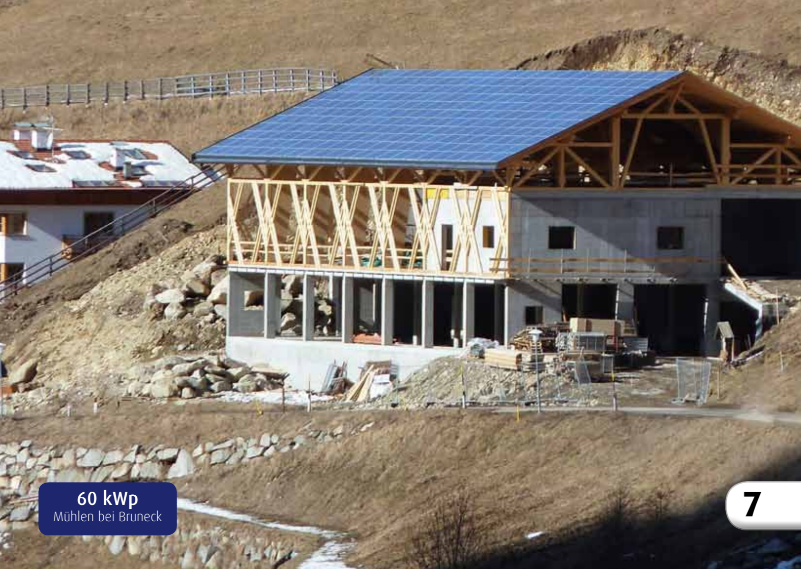
60 kWp Mühlen bei Bruneck