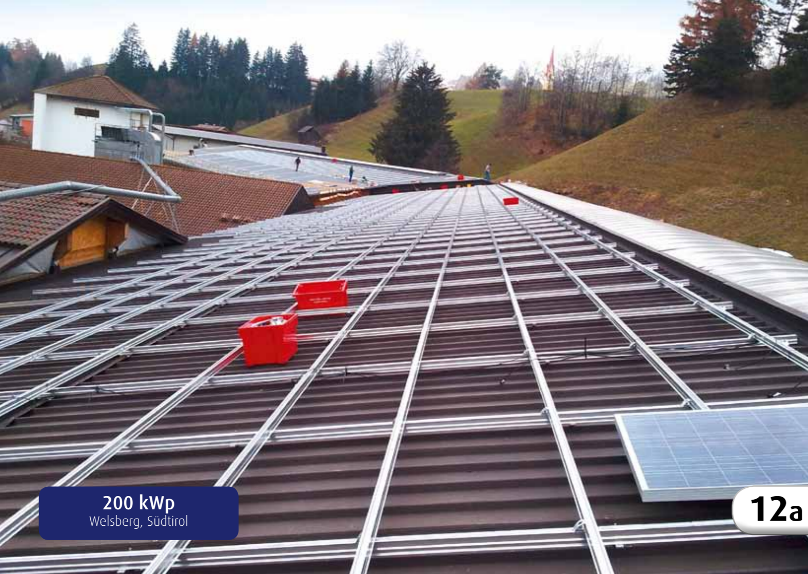
200 kWp Welsberg, Südtirol