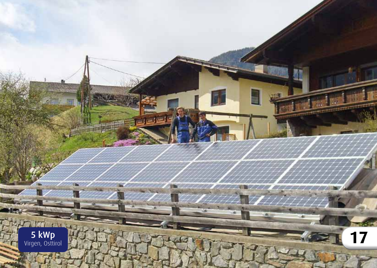
5 kWp Virgen, Osttirol