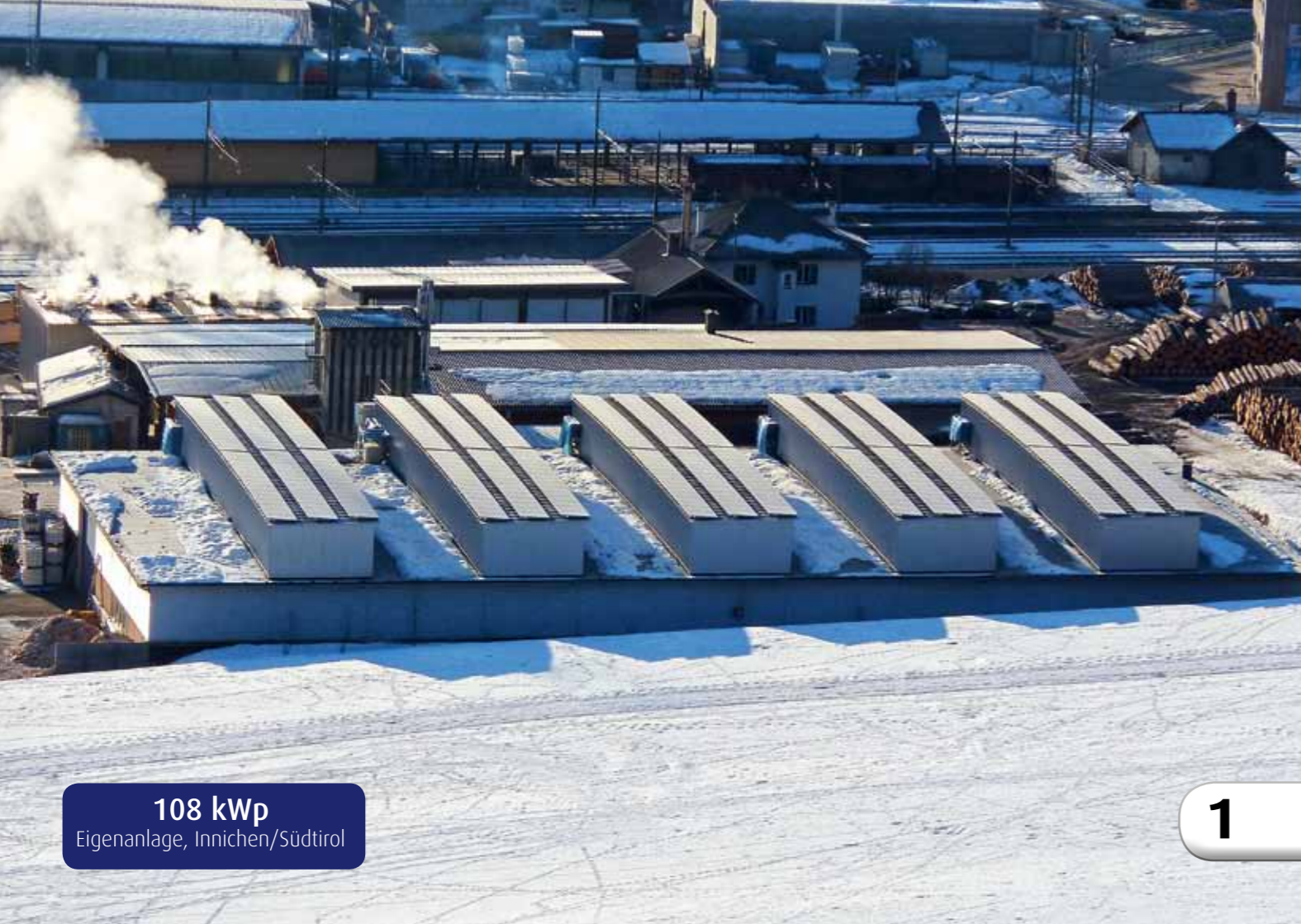
108 kWp Eigenanlage, Innichen/Südtirol