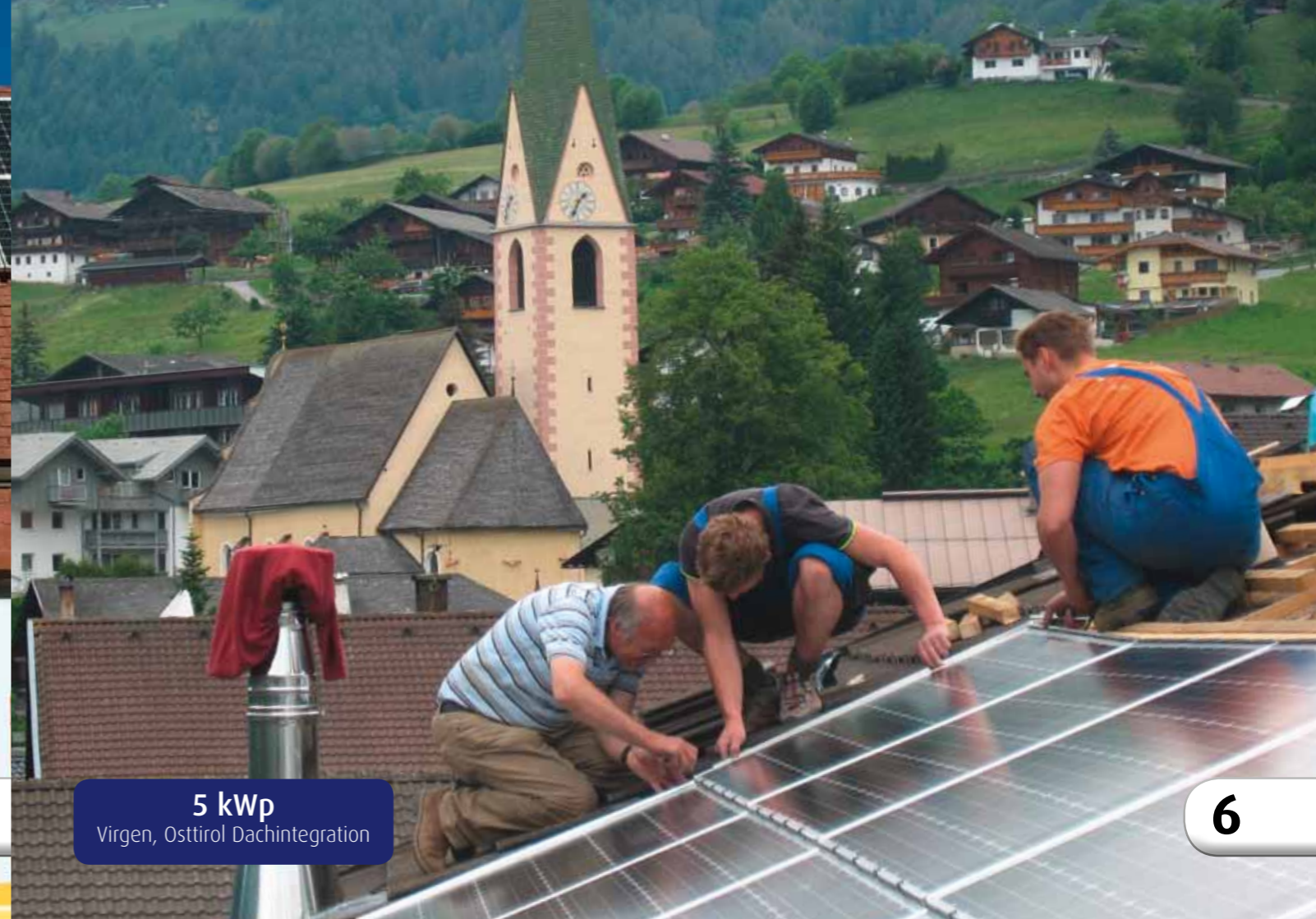
5 kWp Virgen, Osttirol Dachintegration