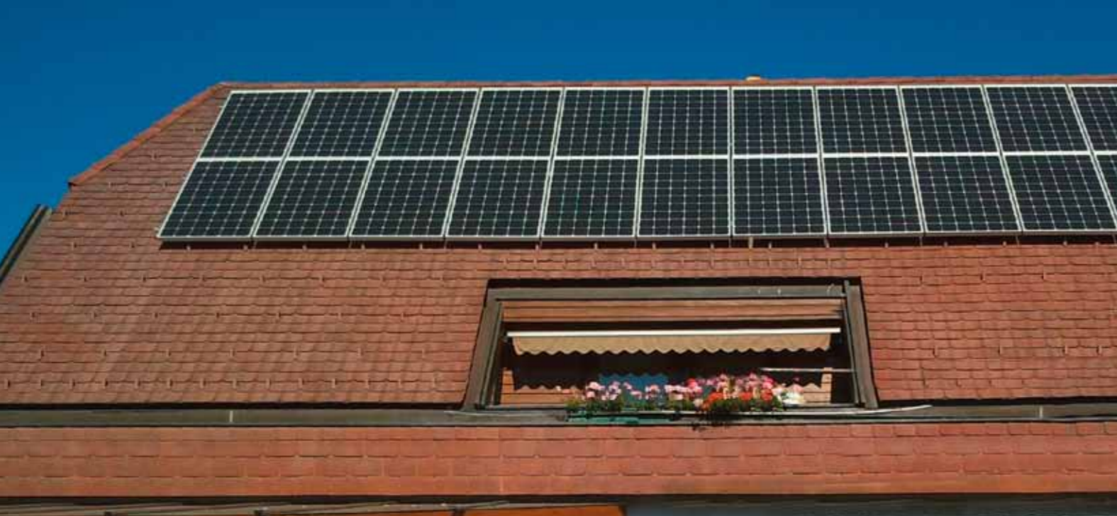
5 kWp Trofaiach, Steiermark