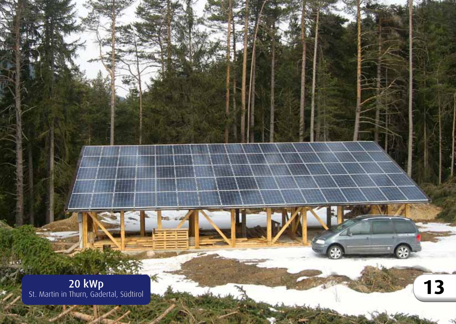
20 kWp St. Martin in Thurn, Gaderal, Südtirol