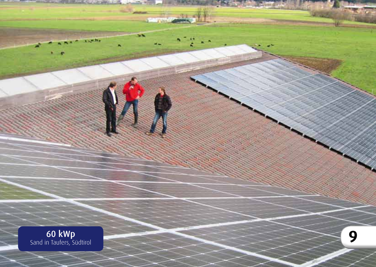
60 kWp Sand in Taufers, Südtirol