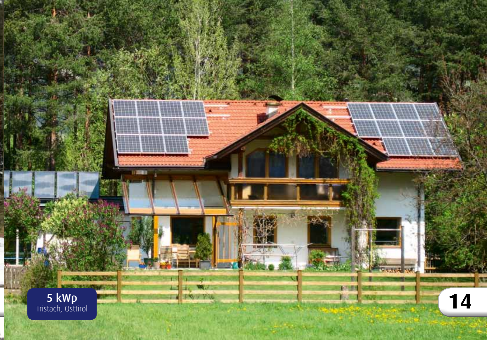
5 kWp Tristach, Osttirol